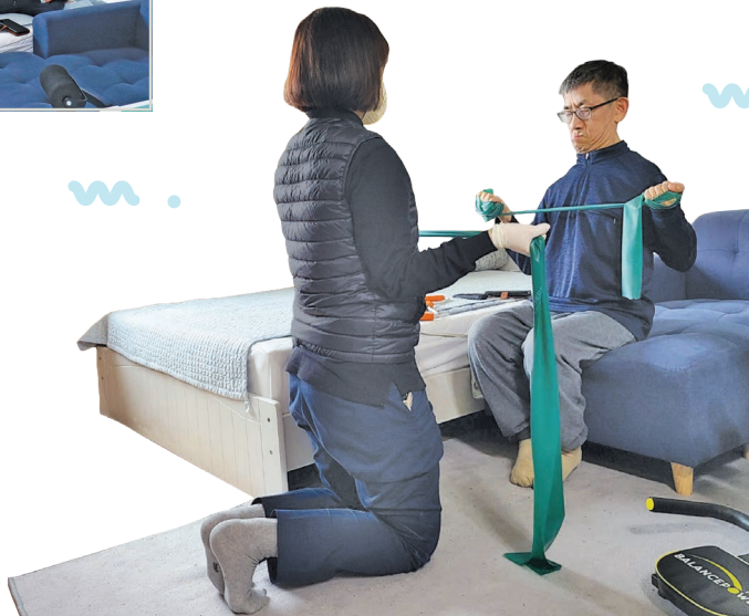
찾아가는 동행상담치료 '가정방문 치료'