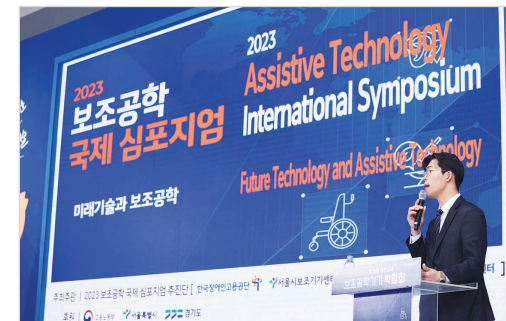
보조공학 국제심포지엄 발표자의 모습

본 센터는 5/26(금)~5/27(토)까지 양재 AT센터에서 심포지엄·홍보부스를 운영하였습니다. 심포지엄은 '미래기술과 보조공학'을 주제로 기초강연 및 발표·토론을 중심으로 진행되었고 유튜브 실시간 중계로 관심이 있는 사람이라면 누구나 참가가 가능하였습니다. 홍보부스는 국내개발 보조기기 전시·체험, 서울시장애인의류리폼사업과 AAC 교육 체계·관련 보조기기 전시로 구성되었고, 이번 행사를 통해 국내·외 미래기술 산업의 동향을 파악하고 지역사회에 보조기기센터의 역할을 알릴 수 있는 좋은 기회가 되었습니다.