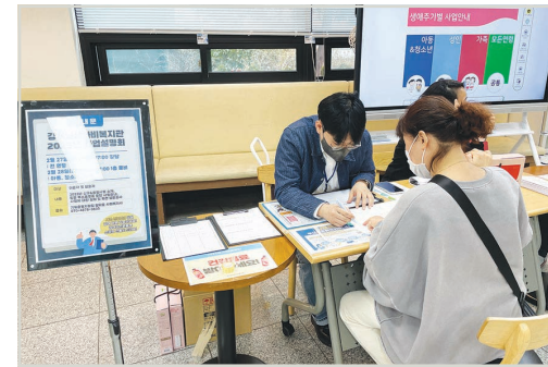
아동&청소년&가족 중심 사업에 대한 부스운영

2/27(월)~2/28(화) 2일간 사업설명회를 진행하였으며, 뇌성마비장애인 71명과 보호자 및 활동지원사 25명 총 96명이 참여하였습니다. 27(월)에는 강당에서 전 연령을 대상으로 팀별 부스운영을 통해 신규 및 중점사업을 안내하고, 28(화)에는 1층 로비에서 아동&청소년&가족을 대상으로 생애주기별 사업을 소개하였습니다.