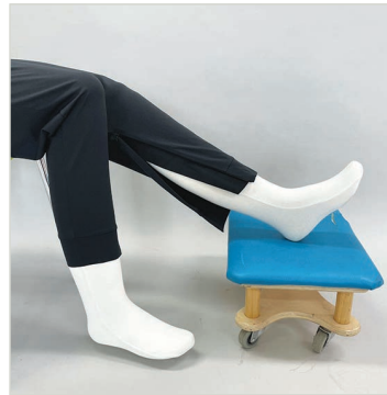
의류리폼 예시 - 밑단 트임