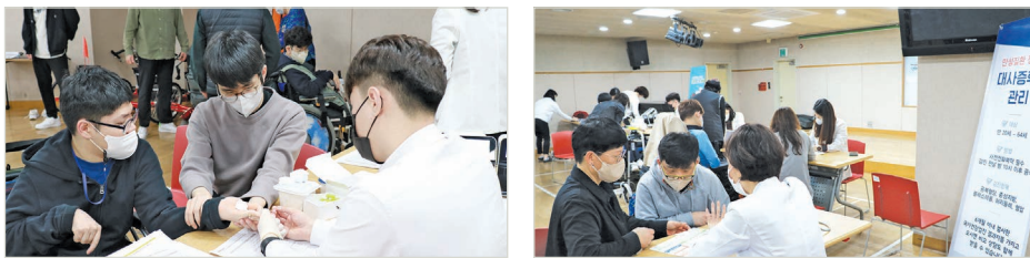
혈액검사 맞춤형 상담

세부내용 3/30(목) 지역사회 협력사업의 일환으로 강서구 보건소에서 진행하는 ‘찾아가는 대사증후군 검진’을 실시 하였습니다. 대사증후군 건강검진은 만20세 이상~64세 미만 복지관을 이용하는 성인뇌성마비장애인 및 가족, 직원을 대상으로 대사증후군 검사(허리둘레, 혈압, 공복혈당, HDL콜레스테롤, 중성지방), 검진 결과에 따른 운동·영양 맞춤형 상담 및 교육, 교육자료 제공 순으로 진행되었으며 총 53명이 참여하였습니다. 이번 검진을 통해 개인의 건강상태 점검과 1:1 맞춤 상담(생활습관 및 개선요법) 및 교육을 제공하여 만성 질환을 예방할 수 있도록 지원하였으며, 특히 대사증후군 검진 결과에 따라 ‘주의군’에 속한 당사자는 6개월 간격으로 지속적인 관리를 할 수 있도록 안내하였습니다.