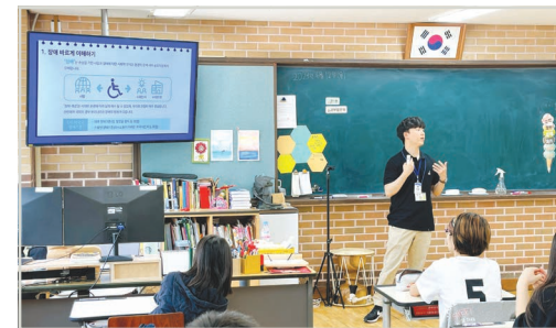
신은초등학교 6학년 반별교육

기획운영지원팀에서는 강서양천특수교육지원청과 연계하여 초·중·고등학교에 신청을 받아 학교로 방문하여 교육을 진행하는 '찾아가는 장애인식개선교육'을 실시하였습니다. 상반기 동안 초등학교 4곳과 고등학교 1곳 총 1,098명 학생들을 대상으로 반별교육과 방송교육을 통해 인식개선을 진행하였습니다. 교육은 뇌성마비장애에 대해 바르게 이해하기, 장애감수성 키우기, 장애에 대한 편견과 비하용어 바로잡기 등 학생들의 눈높이에 맞춰서 쉽게 전달할 수 사진 및 영상자료를 준비했습니다. 하반기에는 여름방학기간이 끝나고 9월부터 학교 5곳을 더 방문해서 교육을 진행할 예정입니다.