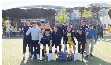
공동 3위 수상 후 단체사진