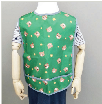
서남보조기기센터에서 직접 제작한 다용도 앞치마