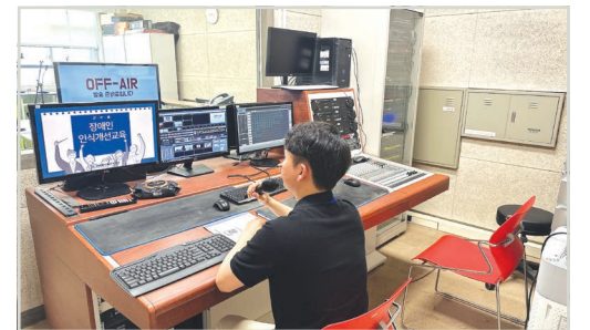
대일고등학교 전학년 방송교육