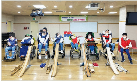
낮활동 교실 체육대회 단체사진

세부내용 4/20(목) 낮활동교실에서는 장애인의 날을 맞이하여 체육대회를 진행하였습니다. 이용자들과 회의를 통해 친숙한 스포츠인 보치아로 대회를 진행하기로 하였고, 기획과 진행에 보치아선수로 활동하고 있는 이용자와 회의를 통해 대회 세부 규칙을 결정하였습니다. 이용자의 충분한 의사반영과 공정한 게임 운영을 위해 정식 보치아 대회 규칙을 적용하였으며 직접 공의 방향, 높이를 선택하며 게임을 진행하였습니다. 대회에서 우승 및 준우승한 팀에게는 낮활동교실에서 준비한 트로피, 메달, 인형꽃, 과자세트를 수여하였습니다. 체육대회에 참여한 이용자 모두 승패와 상관없이 웃는 모습으로 대회를 마무리 하였습니다.