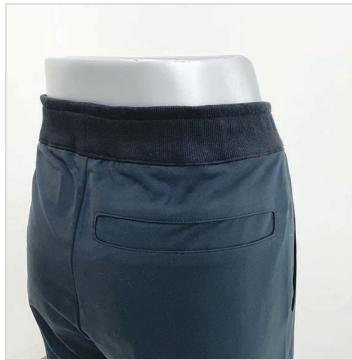
의류리폼 예시 - 뒷주머니 제거

본 센터는 서울시 소재 특수학교 재학생을 대상으로 의류리폼서비스를 실시하였습니다. 한국 우진학교와 협력을 통해 4월부터 6월까지 전교생을 대상으로 '보치아 대회'에서 입을 수 있는 단체 활동복을 지원하였고 리폼 전문가와의 상담을 통한 개인 맞춤 리폼 서비스도 제공하였습니다. 또한 의류리폼 외에도 학교에서 다양도로 활용할 수 있는 식사용 맞춤 앞치마를 제작·지원하였으며 하반기에도 유치부부터 전공과까지 다양한 교과과정에서 필요한 의류를 신청받아 F/W 시즌 의류 지원을 지속할 예정입니다. 이번 사업을 통해 장애 학생들이 다양한 의류를 경험하고 보다 활발하게 교내활동에 참여할 수 있게 되기를 희망합니다.