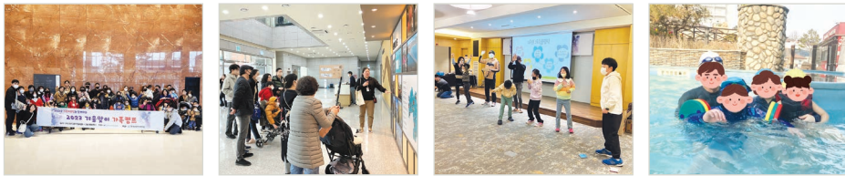
설렘가득 가족캠프 단체사진 내포보부상촌 방문사진 가족레크레이션 진행사진 리솜포레스트 워터파크

세부내용 2/17(금) ~ 2/18(토) 총 1박2일 동안 뇌성마비장애자녀를 양육하는 총 10가족(43명)을 대상으로 설(雪)렘가득 가족캠프를 진행하였습니다. 충청남도 덕산군 예산면 스피러스리솜 리조트에서 스퀘어파크를 통해 온가족이 물놀이도 즐기고 주변 관광지인 내포보부상촌에서 과거 지역의 옛 보부상들의 역사와 다양한 VR체험, 놀이시설까지 경험할 수 있는 알찬 시간이 되었습니다. 또한 가족지원팀만의 특별한 가족단체 레크레이션활동 “모두모여 뽕뽕 가족오락실”을 통해 가족 모두의 화합과 웃음이 가득한 게임을 즐기고 리조트와 주변 관광지의 맛있는 식사 그리고 카페에서 간식들까지 이용할 수 있어 참여한 가족들이 대만족하고 두근두근 설레는 1박2일 캠프가 될 수 있었습니다. 참여한 가족들에게는 개별가족 사진으로 냉장고 마그네틱을 제작해 드리면서 가족캠프에 참여한 시간이 행복한 기억으로 남을 수 있도록 하였습니다. 가족지원팀에서는 앞으로도 새롭고 알찬 가족캠프가 될 수 있도록 노력하겠습니다.