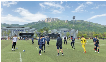
축구경기 전 워밍업

세부내용 4/21(금) 다락원 체육공원에서 본죽컵 제27회 전국뇌성마비인축구대회가 개최되었습니다. 이번 대회는 전국 8개팀이 참가해 토너먼트 경기로 치러졌으며, 본 복지관 축구단 선수들이 참가하였습니다. 8강에서 전북국제FC를 상대로 경기를 리드하며 2-0 2점차로 승리를 하였으나, 4강에서 준우승팀인 전남스포팅을 만나 7-0으로 크게 패하며 아쉽게 공동 3위를 수상하였습니다. 코로나19로 4년만에 개최 된 본죽컵 축구대회를 통해 전국에 있는 뇌성마비축구팀 선수들과 서로 교류 할 수 있는 좋은 기회가 되었고, 선수들끼리 서로 격려하며 다음 대회를 더 열심히 준비하기 위한 계기가 되었습니다.