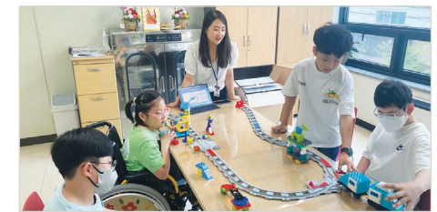
6월 활동모습(액션브릭 기능 응용하기)