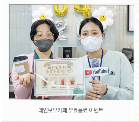
레인보우카페 무료음료 이벤트

4/18(화)~20(목) 복지관에서는 제43회 장애인의 날을 기념하여 '함께해봄, 따뜻한 강서' 주간행사를 진행하였습니다. 3일간 진행된 이번 행사는 '모여봐요~레인보우', '장애인식개선 캠페인', 'THE투어' 3가지 테마를 가지고 실시하였습니다. '모여봐요~레인보우'는 18(화)~20(목) 진행하였으며 뇌성마비 장애인 및 가족뿐만 아니라 복지관에 방문한 모든분들을 대상으로 레인보우카페에서 제조한 무료음료를 1잔씩 제공하였습니다. '장애인식개선 캠페인'은 19(수) 신방화역 사거리에서 진행하였으며 강서구 지역 주민을 대상으로 인식개선퀴즈, 종이화분만들기 체험, 보조기기전시 등의 부스운영을 하였습니다. 아동부터 성인까지 다양한 연령대가 참여하여 장애인의 날에 대해 알리고, 장애에 대한 편견이나 잘못된 정보를 배우는 유익한 캠페인이었습니다. 마지막 날 진행된 'THE 투어'는 20(목) 뉴스포츠후크볼, 캘리그래피 체험, 캐리커처 등 복지관 내에서 다양한 체험활동을 투어하는 형식으로 진행되었습니다. 특히, 캘리그래피 액자만들기는 내가 그리고 싶은 나만의 작품을 직접 만들어서 가질 수 있다는 점에서 큰 호응을 얻었습니다.