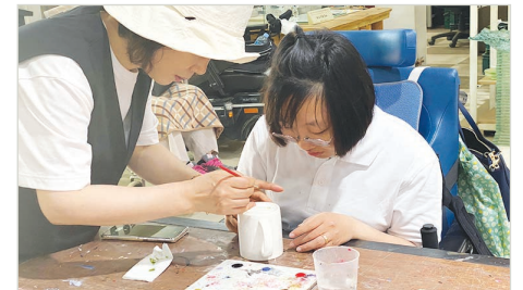
공예활동 (머그컵 페인팅)