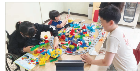
5월 활동모습(액션브릭 기능 배우기)

세부내용 4/19(수) SSCL의 후원으로 서울시장장애인복지시설협회에서 진행하는 “꿈의 엔진을 달다 PLAY BRICK” 사업의 운영기관으로 선정되었습니다. 이에 5월부터 10월까지 월 1회 총 6회기로 구성된 뇌성마비장애 아동 및 청소년 대상 코딩을 활용한 블록놀이 프로그램 플레이브릭교실을 2그룹으로 진행하게 되었습니다. 5월에는 참여자가 블록의 특성을 이해하도록 액션브릭의 역할에 대해 학습하는 활동을 진행하였고, 6월에는 액션브릭의 기능을 활용하여 다양하게 움직이도록 설계해보았습니다. 참여자는 블록놀이와 코딩이 결합된 플레이브릭교실 활동에 흥미를 보이며 자신만의 건축물을 만들어보기도 하였고, 다른 참여자들과 소통하여 기차길을 만들며 여러 방향으로 움직이도록 설계해보는 등 다양한 방법으로 블록 놀이를 하며 프로그램에 적극적으로 참여하였습니다.