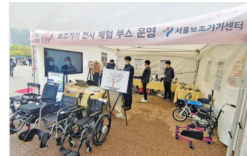
보조기기전시 체험부스 외부

제 43회 장애인의 날을 기념하여 4/18(화) 여의도공원 문화의 마당에서 보조기기 전시·체험부스를 운영하였습니다. 부스에서는 이동보조 및 자세유지를 위한 보조기기와 여러 영역의 보조기기 전시·체험과 장애인의류리폼사업 등 장애인의 행복한 일상을 지원하는데 필요한 다양한 정보를 제공하였습니다. 이번 행사에는 다양한 영역의 장애인 당사자와 가족, 비장애인들이 방문하였으며 부스운영을 통해 장애인 보조기기 관련 정책·정보 안내와 보조기기 및 보조기기센터에 대한 접근성을 향상시킬 수 있는 좋은 기회가 되었습니다.