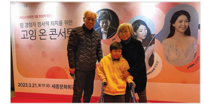
고잉 온 콘서트 관람 기념 가족사진

세부내용 3/21(화) 열린배움터 문화나눔의 일환으로 뇌성마비장애인 및 가족 36명이 세종문화회관에서 <천원의 행복 - 고잉 온 콘서트>를 관람하였습니다. 그동안 코로나로 인해 문화향유 기회가 적었던 뇌성마비장애가족들은 뉴서울필하모닉 오케스트라가 연주하는 아름다운 선율과 소프라노 강혜정, 뮤지컬배우 마이클 리의 노래를 감상할 수 있었습니다. 공연을 관람한 뇌성마비장애인들은 단돈 천원으로 가족과 함께 유명하고 멋진 공연을 볼 수 있어서 좋았다는 감상평을 남겼습니다.