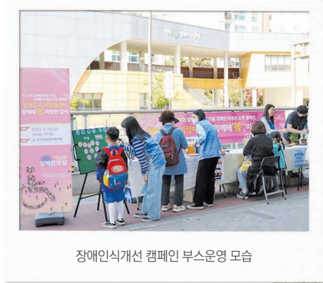
장애인식개선 캠페인 부스운영 모습