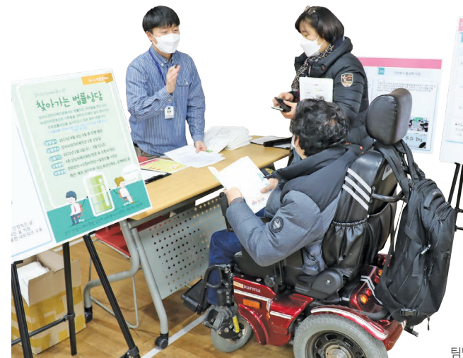
팀별 부스운영(상담 및 기획홍보)

코로나로 인하여 온라인으로 사업설명회를 진행하였다가 오랜만에 대면으로 사업설명회를 할 수 있어서 복지관을 이용하는 뇌성마비장애인 및 가족들 간의 소통이 원활하게 이루어질 수 있었습니다.