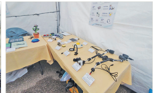
보조기기전시 체험부스 내부