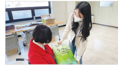
‘맛 좋은 쌀 나눔행사’ 쌀 전달하는 모습

세부내용 3월 ‘맛 좋은 쌀 나눔행사’를 진행하여 총 180가구(1-2인가구는 100가구 10kg, 3인 이상 80가구 20kg)에 쌀 180포대를 전달하였습니다. ‘맛 좋은 쌀 나눔행사’를 통해 제공된 쌀은 강서구청, 강서사회복지관협회, 방화6종합사회복지관에서 후원된 물품으로 이번 행사를 통해 뇌성마비장애인 가정에 건강과 양질의 식사를 지원할 수 있었습니다.