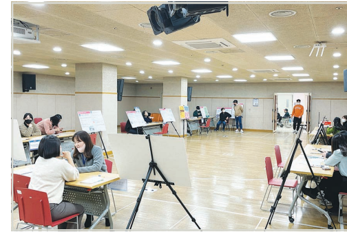
사업설명회 전체 배치모습